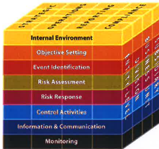
ภาพกระบวนการบริหารจัดการความเสี่ยง

กระบวนการบริหารความเสี่ยงที่ ๘ องค์ประกอบที่มีความเกี่ยวข้องของกันและกัน ทั้งนี้องค์ประกอบเหล่านี้เกิดจากการปฏิบัติงานร่วมของฝ่ายบริหาร ฝ่ายปฏิบัติงาน และฝ่ายสนับสนุน ครอบคลุมทุกหน่วยงานในองค์กร ผสมผสานเข้ากับกลยุทธ์ในการบริหารจัดการ โดยมีความเชื่อมโยงกันในทุกระดับ